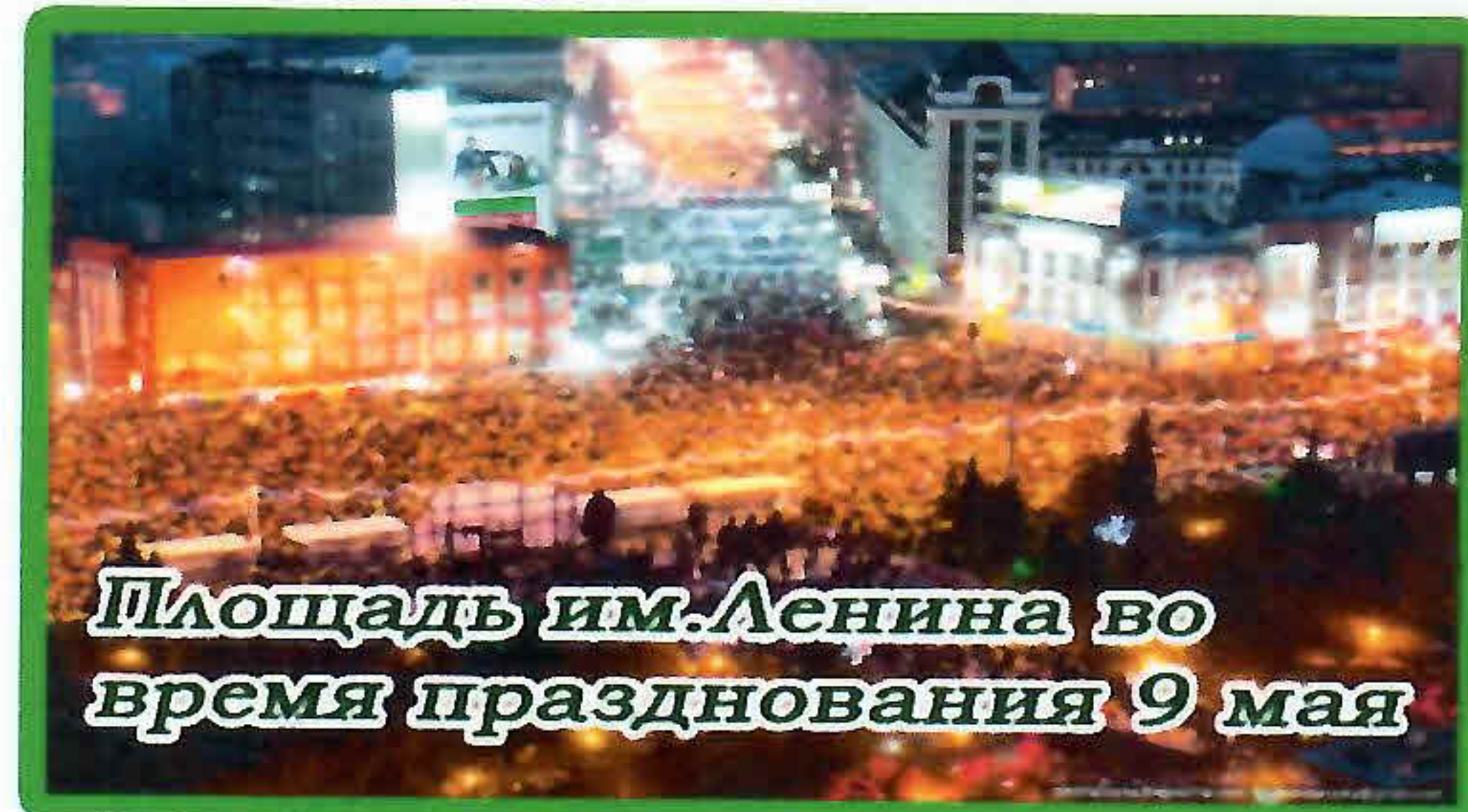
Площадь им.Ленина во время празднования 9 мая

Ведь родной город – это всегда близкий нашему сердцу край. Пусть он станет таким и для наших детей. Покажите ребенку праздничный город, его улицы при вечернем освещении. Это произведет большое впечатление на него. Пусть потом дома он отразит увиденное в своих рисунках.