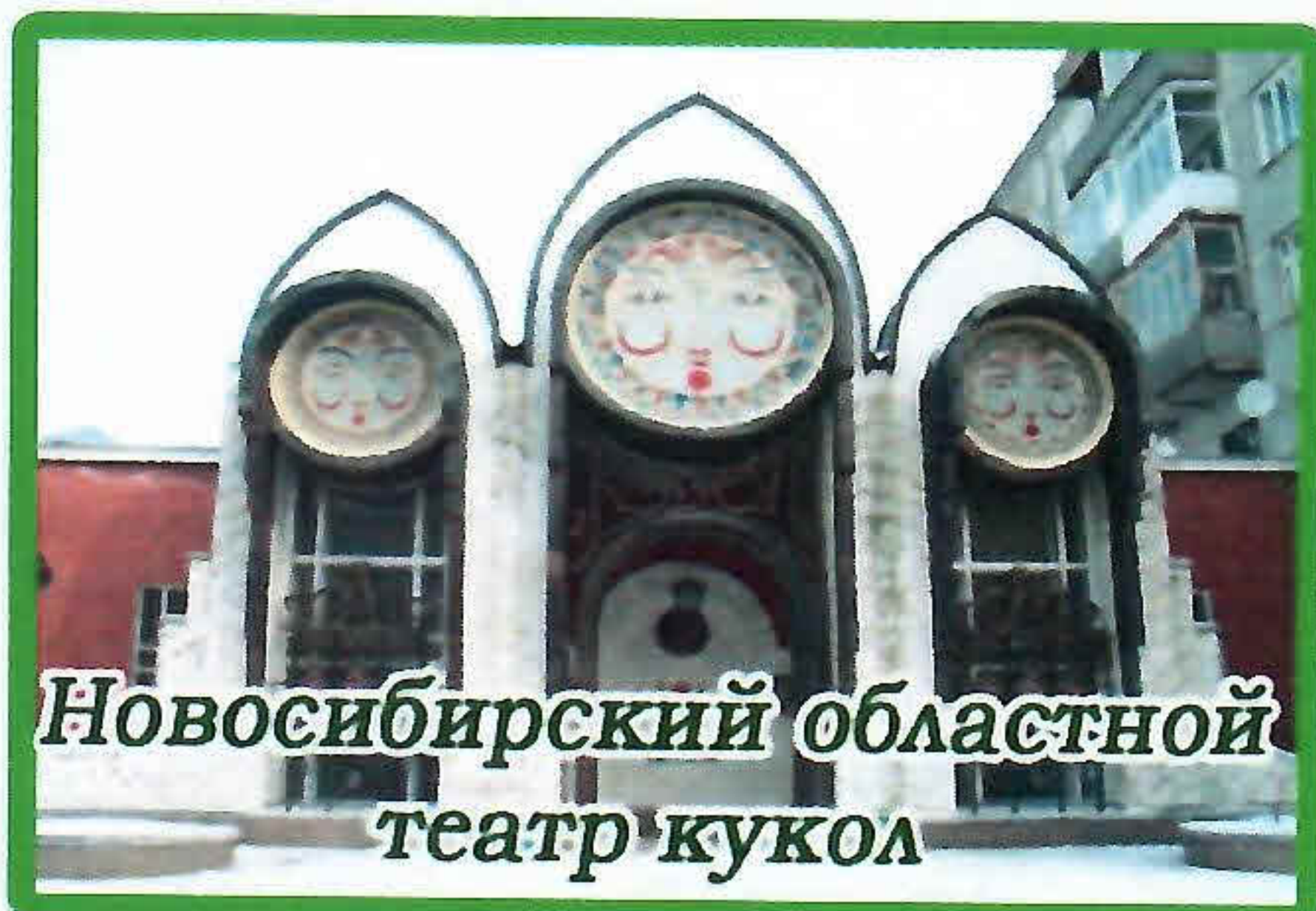
Новосибирский областной театр кукол

Уважаемые родители! Любите свой край! И свою любовь к нему передавайте детям!