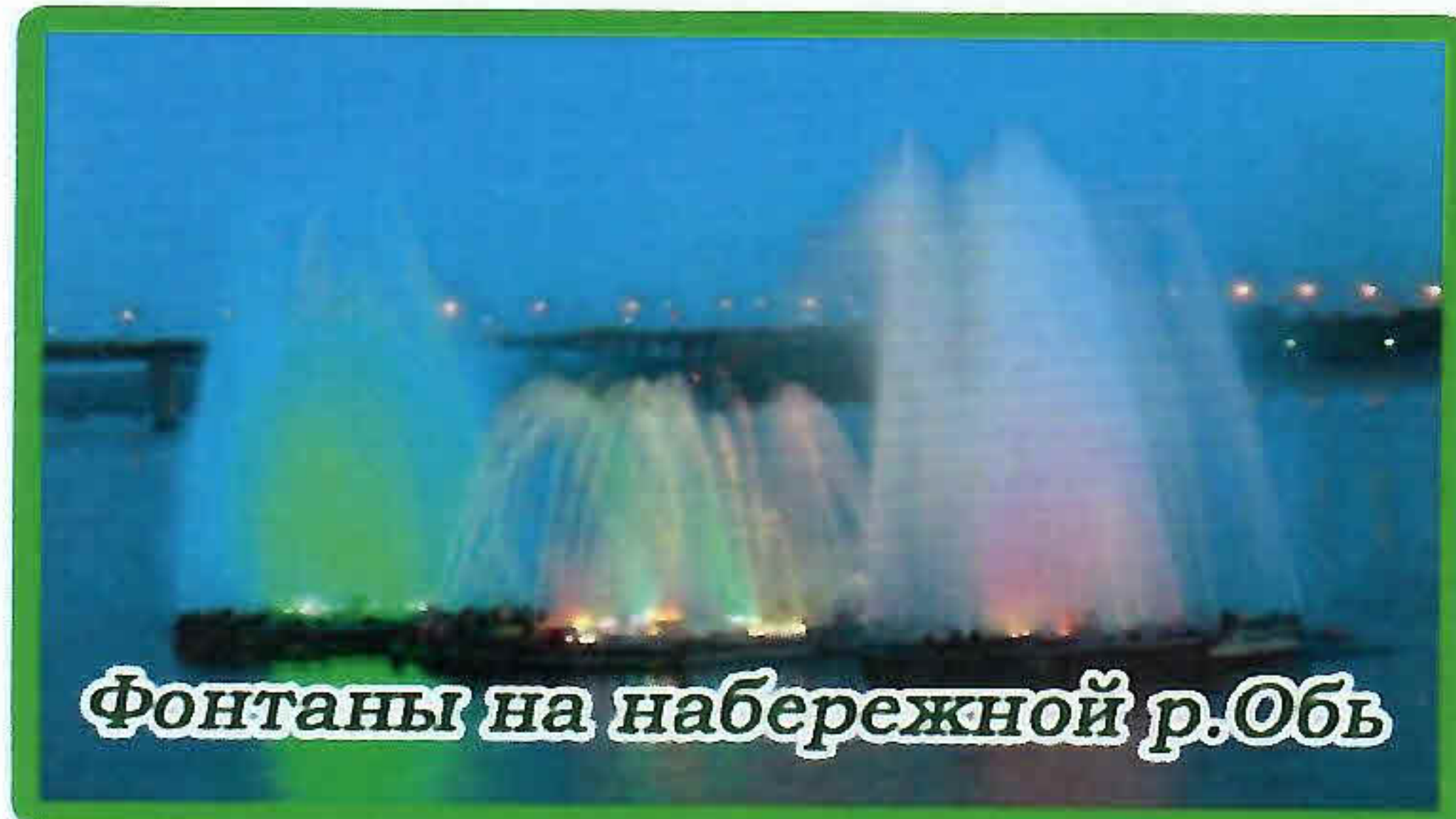
Фонтаны на набережной р.Обь