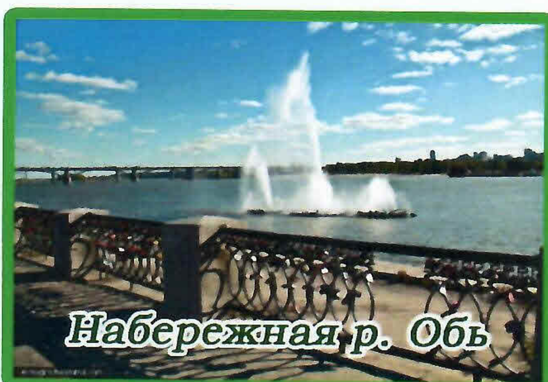
Набережная р. Обь