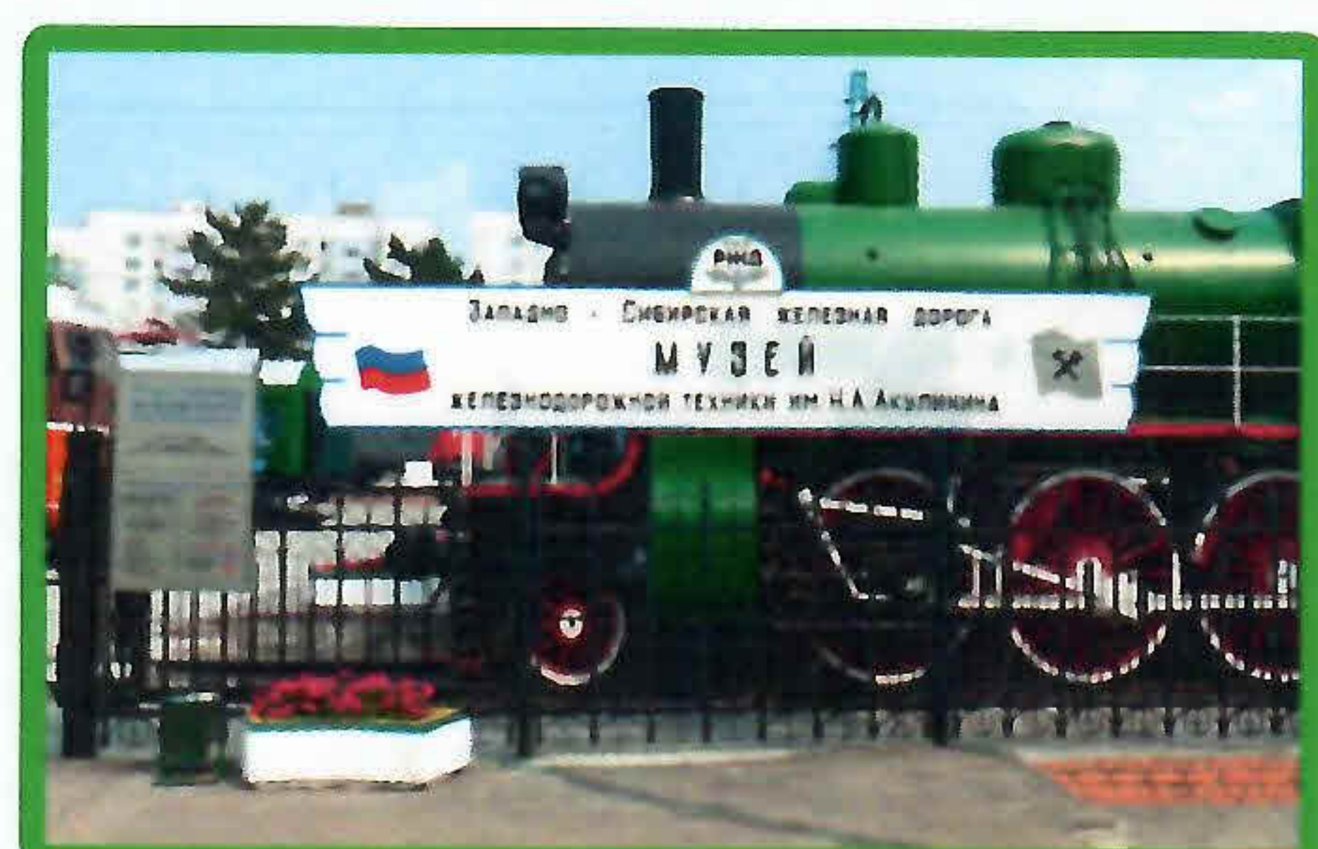
Музей железнодорожной техники им. А.А. Аксакина