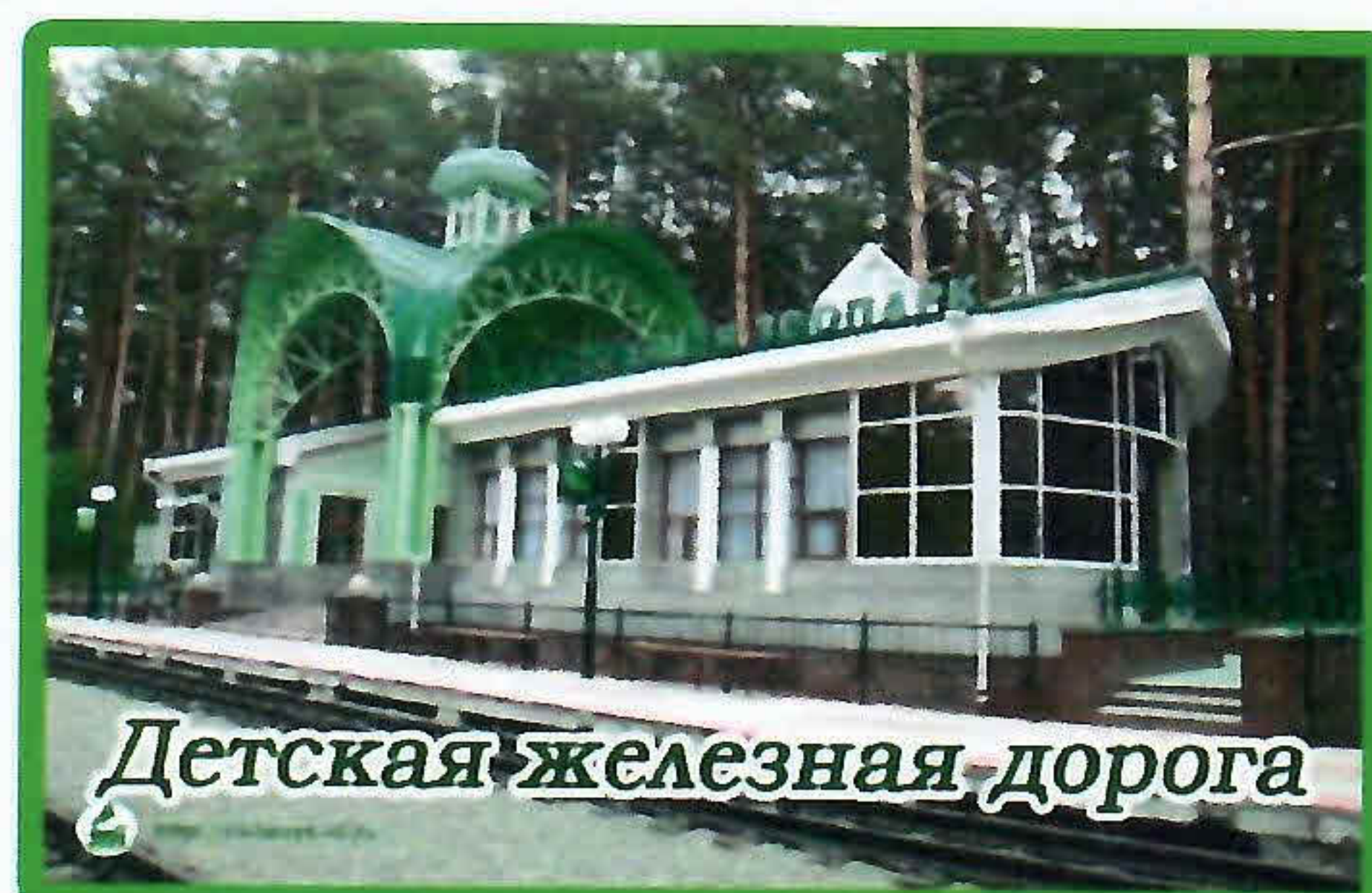
Детская железная дорога